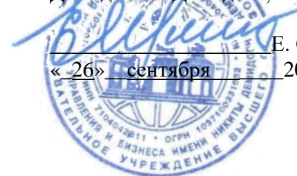
ГРАФИК ПРОВЕДЕНИЯ ВСТУПИТЕЛЬНЫХ ИСПЫТАНИЙ СРЕДИ ПОСТУПАЮЩИХ НА ОБУЧЕНИЕ ПО ОБРАЗОВАТЕЛЬНЫМ ПРОГРАММАМ ВЫСШЕГО ОБРАЗОВАНИЯ НА ОЧНО-ЗАОЧНУЮ ФОРМУ ОБУЧЕНИЯ НА 2022/2023 УЧЕБНЫЙ ГОД (ДОПОЛНИТЕЛЬНЫЙ НАБОР) (редакция от 26.09.2022 г. )