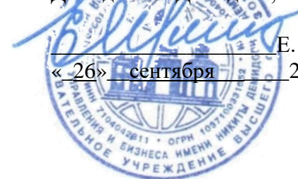
ГРАФИК ПРОВЕДЕНИЯ ВСТУПИТЕЛЬНЫХ ИСПЫТАНИЙ СРЕДИ ПОСТУПАЮЩИХ НА ОБУЧЕНИЕ ПО ОБРАЗОВАТЕЛЬНЫМ ПРОГРАММАМ ВЫСШЕГО ОБРАЗОВАНИЯ НА ОЧНО-ЗАОЧНУЮ ФОРМУ ОБУЧЕНИЯ НА 2022/2023 УЧЕБНЫЙ ГОД (ДОПОЛНИТЕЛЬНЫЙ НАБОР) (редакция от 26.09.2022 г. )